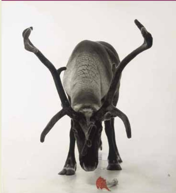
Carsten Höller, „Rentierkopf“, 2010, Gravüre, Ex. 34/55, 77,6 x 96 cm, Sammlung der Schering Stiftung im Berliner Kupferstichkabinett, Foto: Volker-H. Schneider, Berlin, © VG Bild-Kunst, Bonn 2011

Die Staatlichen Museen zu Berlin sind eine Einrichtung der Stiftung Preußischer Kulturbesitz.