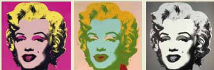
Andy Warhol: „Marilyn“, 1967 (aus der 10-teiligen Serie), Siebdruck, je 91,5 x 91,5 cm, Staatliche Museen zu Berlin, Kupferstichkabinett

Angeregt wurde die Ausstellung durch eine Schenkung von 30 Editionen Sigmar Polkes durch Wolfgang Wittrock (Berlin) an das Kupferstichkabinett im Jahr 2007.