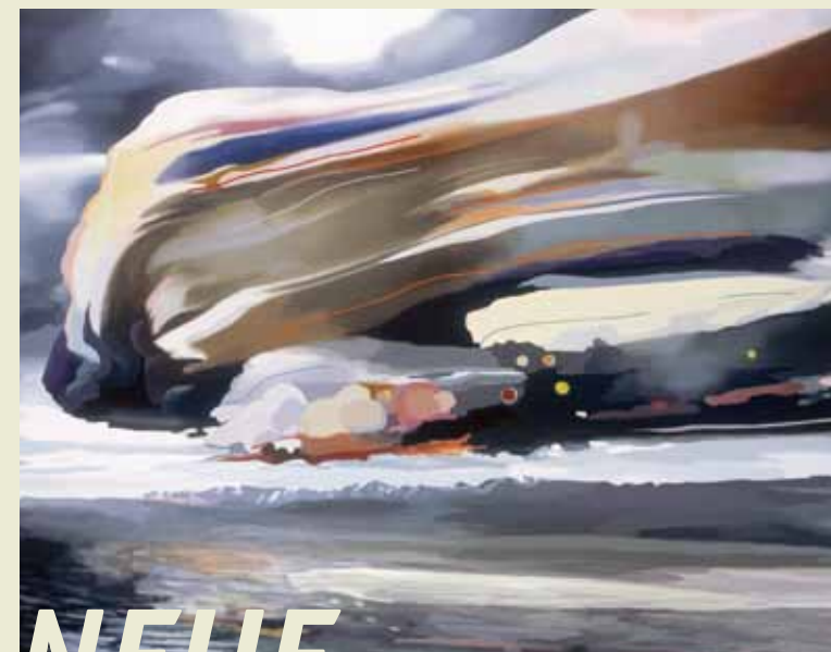
Abb. Titel: Kai Schiemenz, „Wolke“ (Detail), 2005, Inkjet-Print, 90 x 126,5 cm, Staatliche Museen zu Berlin, Kupferstichkabinett, erworben aus Mitteln der Deutschen Klassenlotterie Berlin von der Kulturverwaltung des Berliner Senats, 2007, Foto: Volker-H. Schneider, Berlin, © Kai Schiemenz